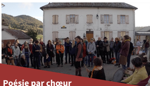
Poésie par chœur

Une superbe édition ! de l'avis des participants qui s'est déroulée du 8 au 12 octobre entre le Chalet de Varambon à 1500m d'altitude et La fraternelle Maison du peuple de Saint-Claude en passant par les belles combes de Bellecombe et des Bouchoux pour s'achever au maraîchage bio d'Armelle et Laurent sur la commune de Lavans-les-Saint-Claude