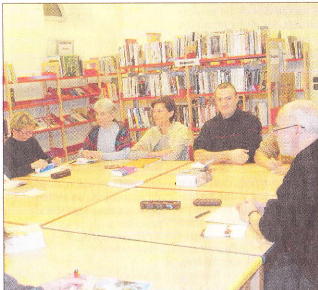
Les mots pour exprimer des émotions